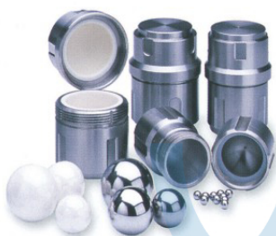
MM400 Grinding Jars & Balls