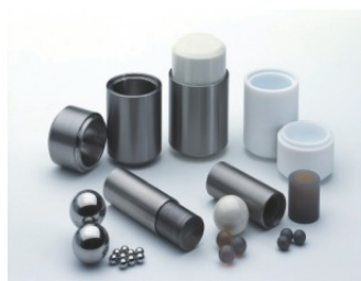
MM200 Grinding Jars & Balls