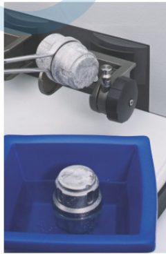
Cryo Kit &amp; Accessories