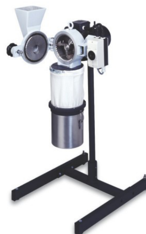
交叉撞擊式粉碎機 SK100