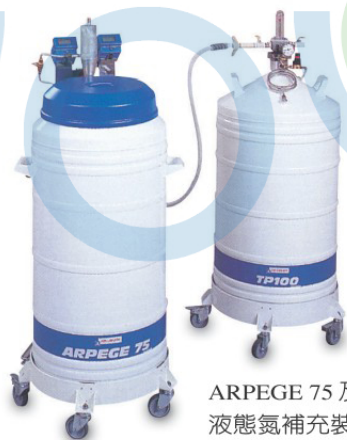
ARPEGE 75 及自動 液態氮補充裝置 保持樣品維持在有 LN 2 儲存狀態