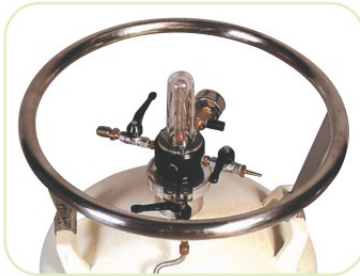
特殊安全閥門設計