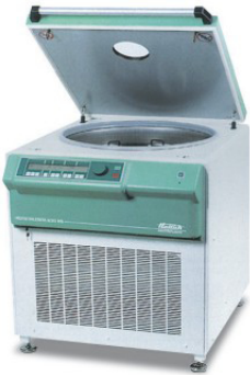
ROTO SILENTA 630RS