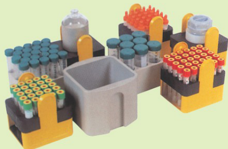
各式離心管均可相容，歡迎來電詢問