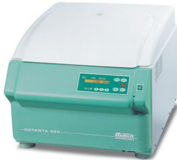
ROTANTA 460 / 460S