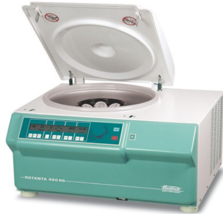
ROTANTA 460R / 460RS