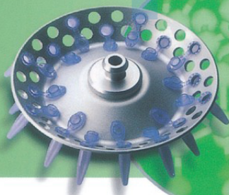
● Rotor F-45-48-11 : 48 × 1.5 / 2.0 ml Eppendorf Tubes®