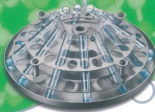
● Rotor F-45-24-12 : 24 × 6 ml Tubes