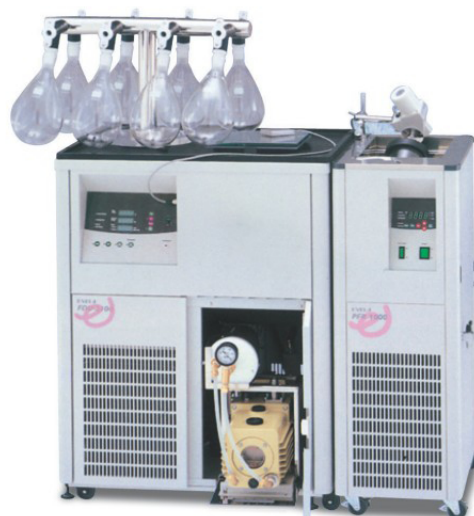
FDU-1100 (左) 搭配 PMH-8 多歧管及 PFR-1000 (右) 預備凍結槽 (-45°C)