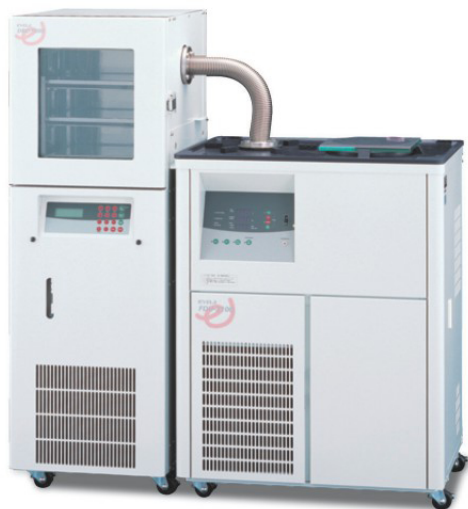
搭配 DRC-1000 (左) 可一次凍乾 10 mL 乾燥瓶 270 個 (共三層)