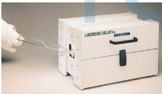
HTF55322C / 1200°C 單區管狀爐