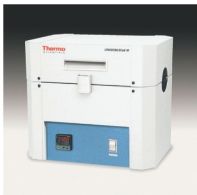
TF55035C / 1100°C 單區管狀爐