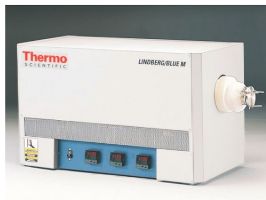
STF55346C / 1100°C 三區管狀爐