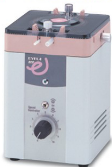
MP-1000 · 1000S