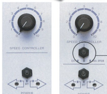
SMP-21 · 23