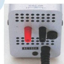
外部訊號輸入端子