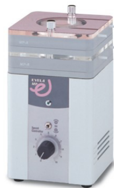
MP-1100A · 1100B