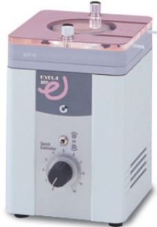
MP-1000A · 1000B