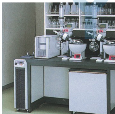
側邊置放並可移動 (CA-1113)