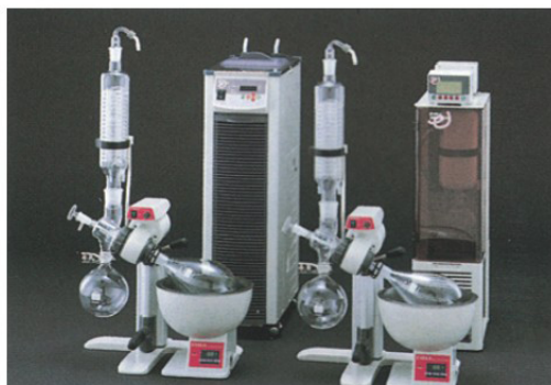
1 對 2 冷卻效果優 (CA-1113)