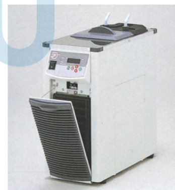
前門開啓保養方便