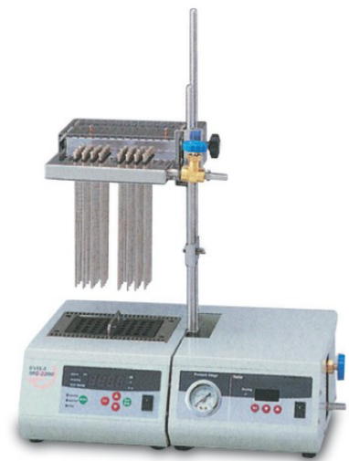
MGS-2200 + MGS HEAT