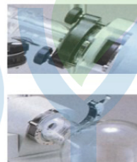
one touch clamp 固定、拆卸容易