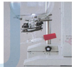
易回收 drain valve