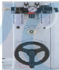
Air motor 驅動